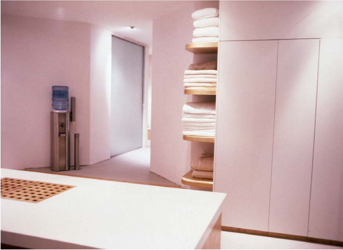
Eingang zu den Treatment Räumen