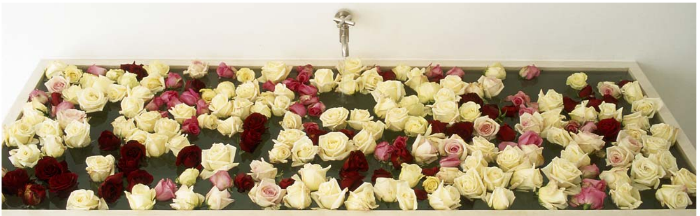
Rosenbecken im Spa Bereich

- Just Pure DaySpa, Siegesstraße 13, München, Tel. 089/38356999, www.justpure.com