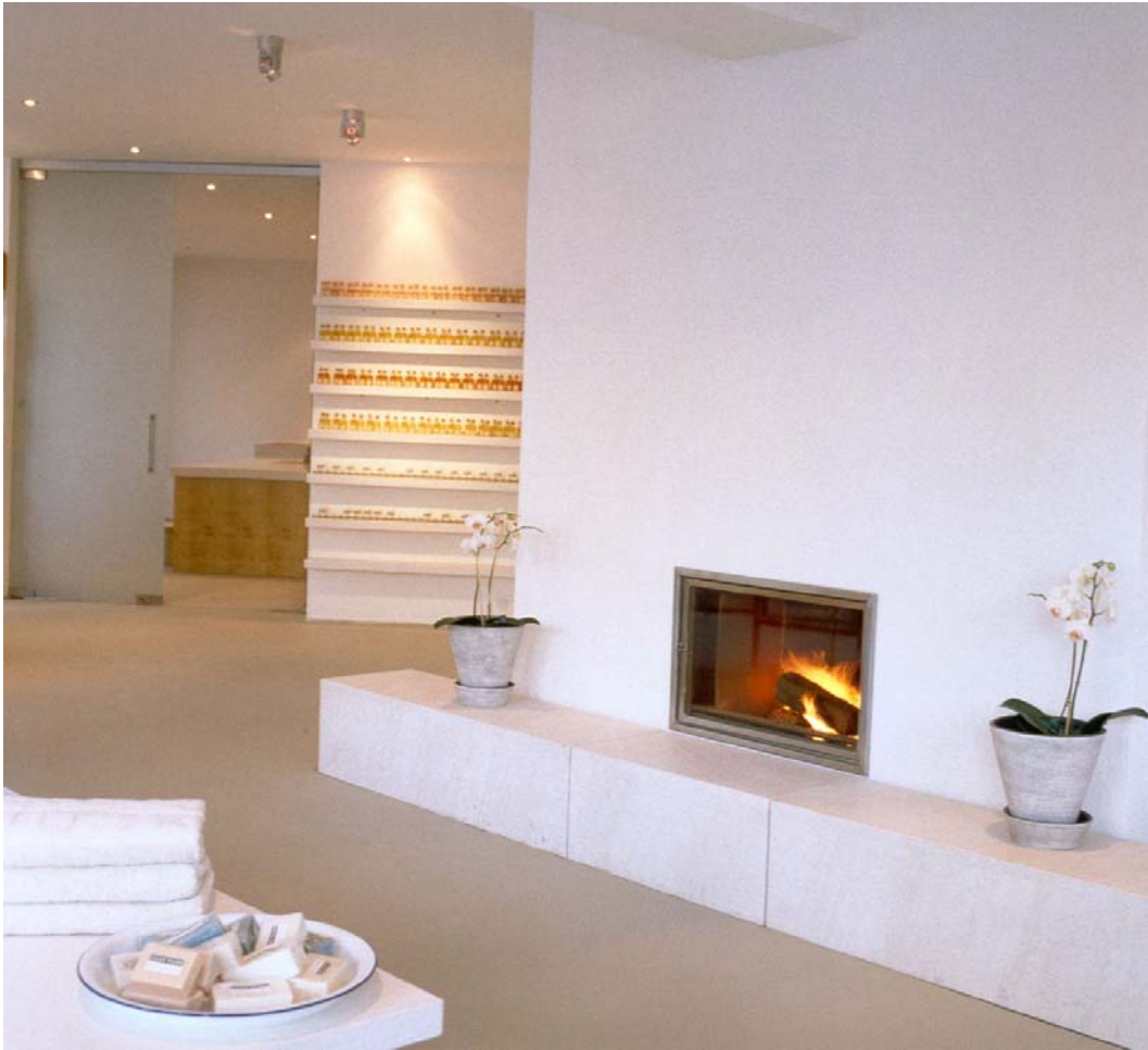
Verkaufsraum mit offenem Kamin