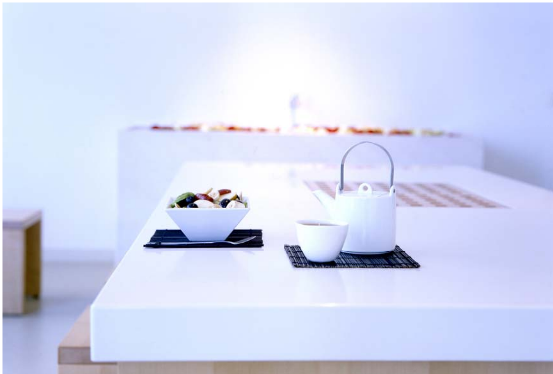
Spa Raum mit Mittagstisch