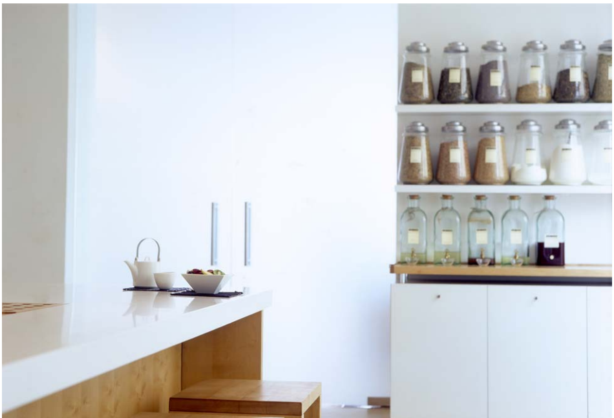
Spa Vorraum mit Rohstoffen