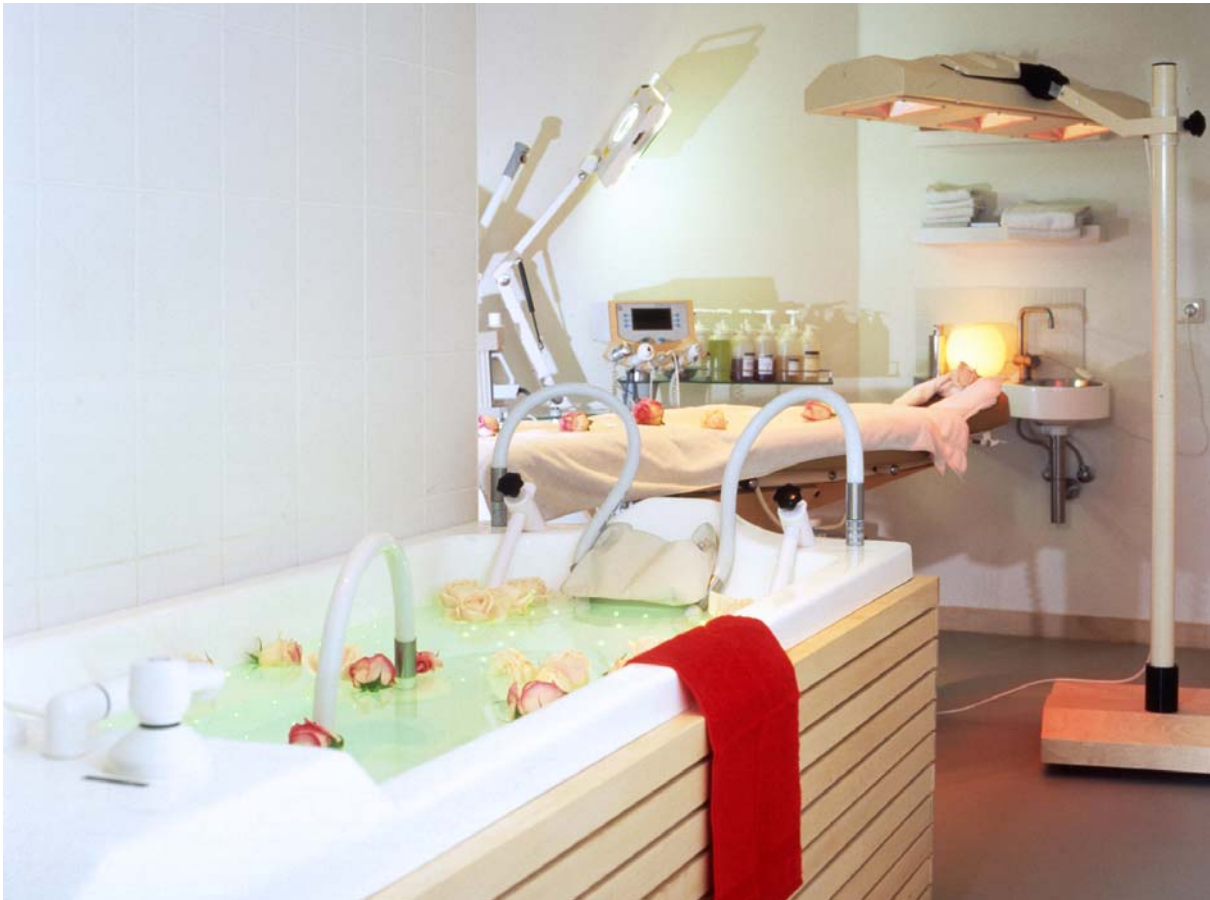
Treatment Raum No. 1